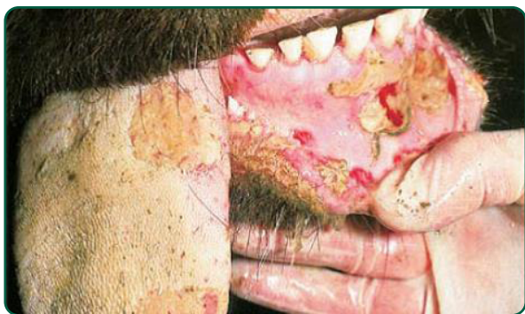
Cavidade oral e língua de bovino com lesão de quatro dias. Notar a progressiva perda das margens antes muito evidentes e considerável deposição de exsudato fibrinoso.