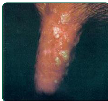
Vesícula de um dia em teto de vaca. As vesículas estão íntegras e várias delas coalesceram.