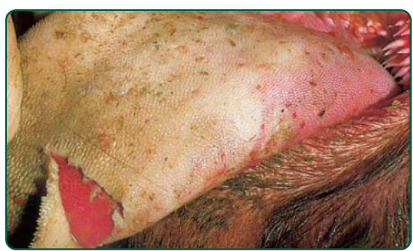
Lesões de dois dias na boca de bovino. Notar as margens evidentes das lesões e o assoalho vermelho vivo da derme exposta.