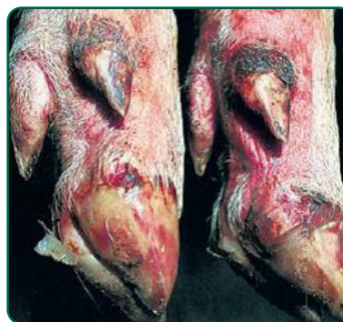
Pata de suíno com lesões de oito dias. Sob o tecido queratinizado do casco é evidente a grande formação de crostas durante o processo de reparação.