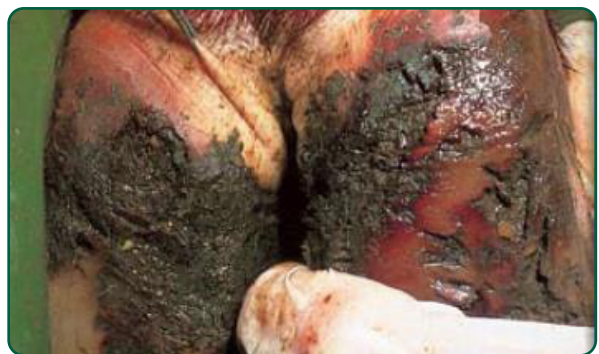
Bulbo do talão de um bovino com vesículas ainda não rompidas de dois dias.