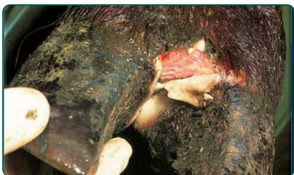
Bovino com lesão podal de sete dias.