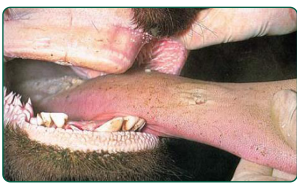
Língua de bovino com vesícula de um dia, rompida quando a língua foi puxada para fora da boca.

Imagens (extraídas do Manual “Coletânea de Imagens”, elaborado pelo MAPA)