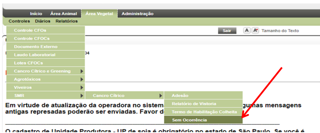
Figura 01 – Tela para acesso para solicitação de identificação de imóvel sem ocorrência de cancro cítrico